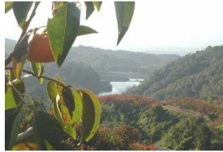
秋の一の木ダム(農業用)